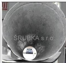
Po vyčistení komína