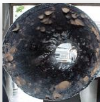
Pôsobenie po 15 dní